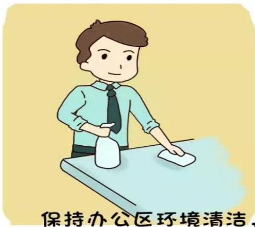
保持办公区环境清洁， 通风时注意保暖。