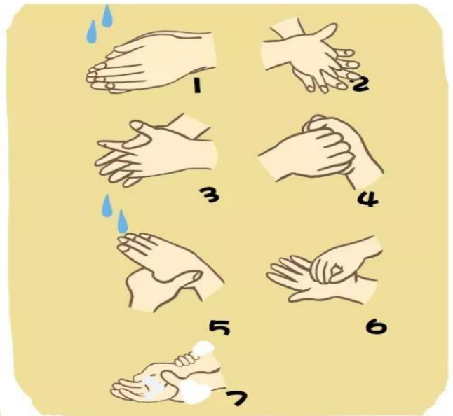
按照七步法严格洗手。