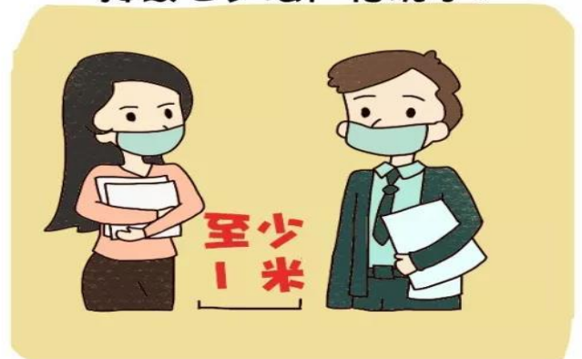
接待外来人员时双方要佩戴口罩。