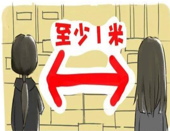
③保持至少1米以上距离