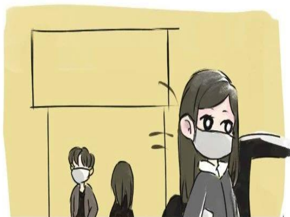
④避免公共场所长时间停留

须佩戴口罩出行，避开密集人群。与人接触保持1米以上距离，避免在公共场所长时间停留。